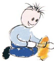
Manipola e fa ruotare gli oggetti