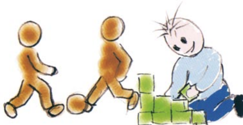
Non gioca con gli altri bambini