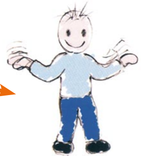
Si comporta in modo strano