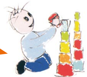
Assenza di creatività e di immaginazione nel gioco