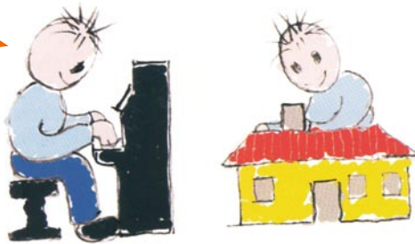
Dimostrano talvolta abilità e destrezza particolari, ma sempre al di fuori delle attività che comportano comprensione sociale