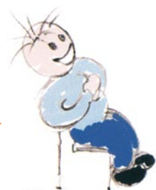
Ride senza motivo