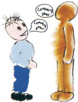
Circa la metà dei soggetti autistici non parla. Chi possiede il linguaggio lo utilizza in modo bizzarro.